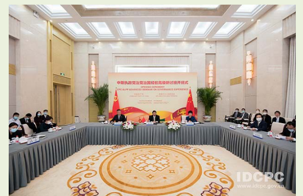
Cérémonie en ligne du séminaire PCC-SLPP sur l'expérience de la gouvernance.

Le 4 novembre 2020, le Département international du Comité central du PCC (DIPCC) a organisé une cérémonie d'ouverture en ligne du séminaire sur l'expérience de la gouvernance du PCC et du Front populaire du Sri Lanka (SLPP). M. Song Tao, ministre de l'IDCPC, M. Liu Cigui, secrétaire du Comité de la province de Hainan du PCC; M. Mahinda Abeywardena, président du Parlement sri-lankais; G. L. Peiris, Président du Front populaire et ministre de l'éducation, et Sagara Kariyawasam, Secrétaire général du SLPP ont participé et ont pris la parole à la cérémonie vidéo.