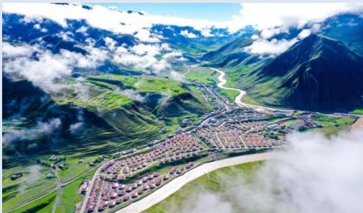
Une photo aérienne prise le 14 juin 2020 démontre une zone relocalisée près de la rivière Gaqu au bourg de Chido du district de Dengqen à Qamdo, dans la région autonome du Tibet au sud-ouest de la Chine. La ville de Qadom a vu un total de 194,600 habitants, 38,400 familles, 1,127 villages et 11 districts se sont déjà débarrassés de la pauvreté grâce aux efforts de lutte contre la pauvreté.

La Chine devrait améliorer le mécanisme de suivi et d'assistance pour empêcher les gens de retomber dans la pauvreté et continuer à suivre le développement des districts, des villages et des gens qui ont été hors de la pauvreté, a noté la Session.