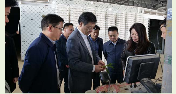
Groupe de CELAP à la base de culture potagère du village de Cenmang, district de Jiangkou

Le groupe s'est successivement rendu à la base de culture potagère pour l'approvisionnement des légumes à la Grande Région Guangdong-Hong Kong-Macau Greater, au centre de services des communautés et à la zone de réinstallation pour la lutte contre la pauvreté au village de Cenmang, Jiangkou. Ils ont également visité des ménages démunis et des fonctionnaires déplacés qui se consacrent à la lutte contre la pauvreté pour connaître davantage les réalisations de Jiangkou en matière de gouvernance à la base, de développement des industries et de délocalisation des habitants en pauvreté.